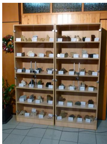
Geološka zbirka Primorsko-goranske županije

Kao krunu rada Udruge istaknuli bi uspostavljanje „ Geološke zbirke Primorsko-goranske županije “ 17.12. u OŠ Gornja Vežica u Rijeci. Zbirka je nastala zajedničkim projektom UPRIS-a i našeg dugogodišnjeg partnera Hrvatskog geološkog instituta. Učenik koji je osvojio 1. mjesto na prošlogodišnjem natjecanju u sklopu projekta „ Škola mladih riječkih geologa 2014. “ osvojio je ovu zbirku za svoju školu.