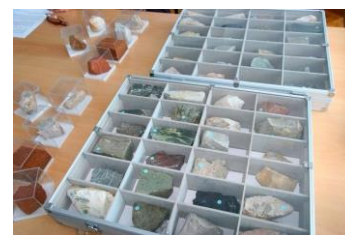
Prijenosna geološka zbirka

Također, nastavno sredstvo Udruge „Geološka zbirka u školi“ je naručeno od strane jedne osnovne škole, što čini broj od ukupno 24 osnovne i srednje škole u Hrvatskoj s našom zbirkom.