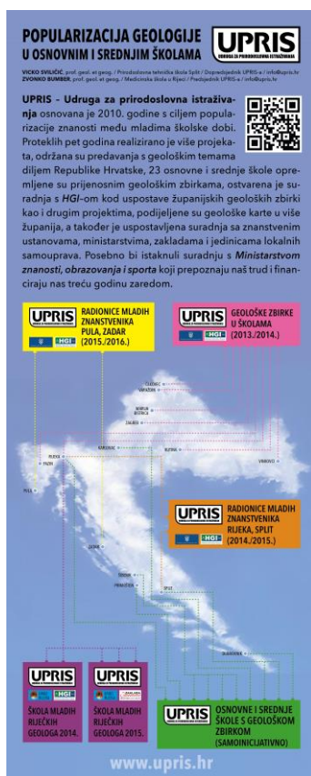
Plakat na kongresu

Kao krunu rada Udruge istaknuli bi uspostavljanje „ Geološke zbirke Primorsko-goranske županije “ 17.12. u OŠ Gornja Vežica u Rijeci. Zbirka je nastala zajedničkim projektom UPRIS-a i našeg dugogodišnjeg partnera Hrvatskog geološkog instituta. Učenik koji je osvojio 1. mjesto na prošlogodišnjem natjecanju u sklopu projekta „ Škola mladih riječkih geologa 2014. “ osvojio je ovu zbirku za svoju školu.