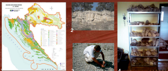
Nastanak zbirke 1-4.